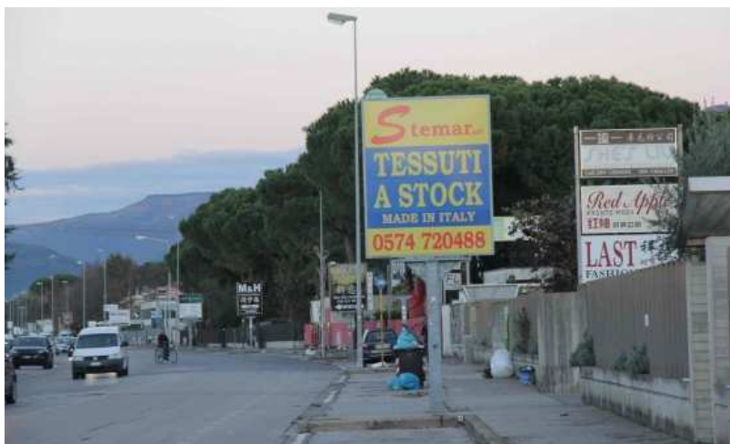
Una delle strade del Macrolotto Uno